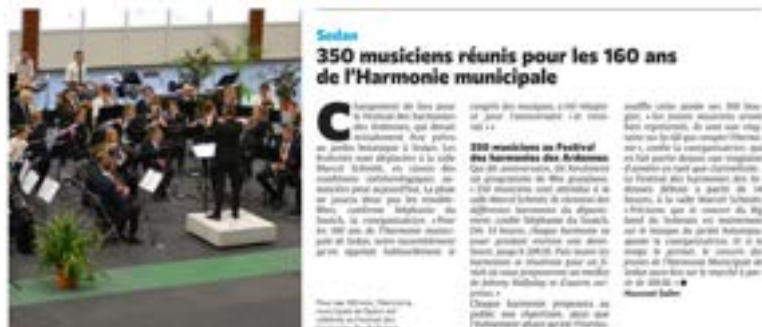
L'Harmonie de Sedan rythme la vie musicale municipale depuis 160 ans. Son histoire a évolué et lui permet de conforter un effectif stable, cette année : 56 musiciens dont 23 enfants. Tous mobilisés pour l'ensemble des manifestations : Concerts, animations de rue, cérémonies patriotiques et projets originaux, en orchestre ou en petits effectifs.