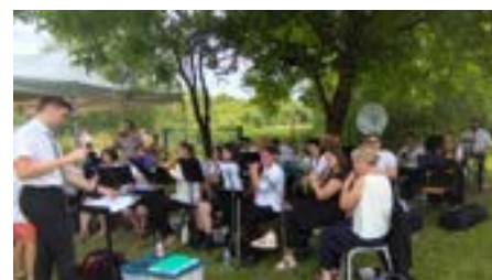
14 juillet : concert bucolique pour la Fête Nationale à Warcq