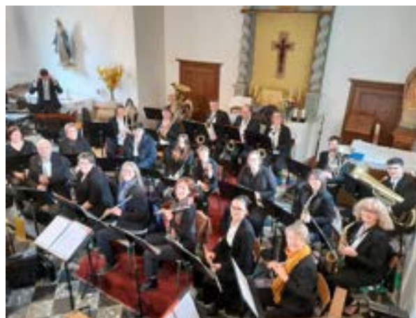
30 mars inauguration de l'église de Warnécourt