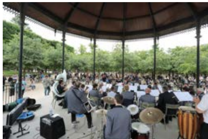
24 mai 2025 : L'Harmonie Municipale de Givet à Paris, kiosque des Jardins du Luxembourg