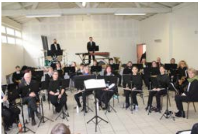
12 janvier : Concert à Wadelincourt pour la nouvelle année

Voici une rétrospective en image de l'année 2025 de l'Harmonie de Warcq :