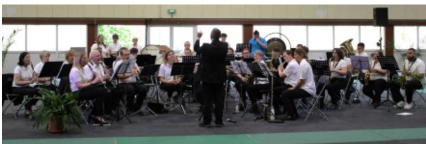
Congrès de Sedan