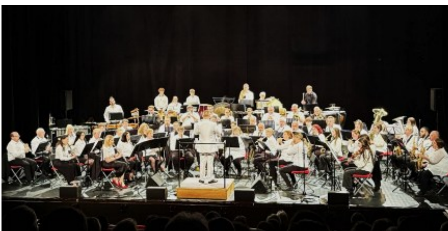
Le concert des 160 ans