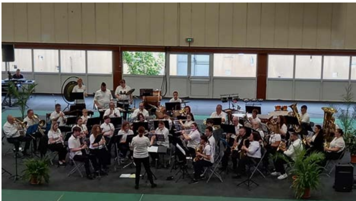
Harmonie Municipale de Fumay