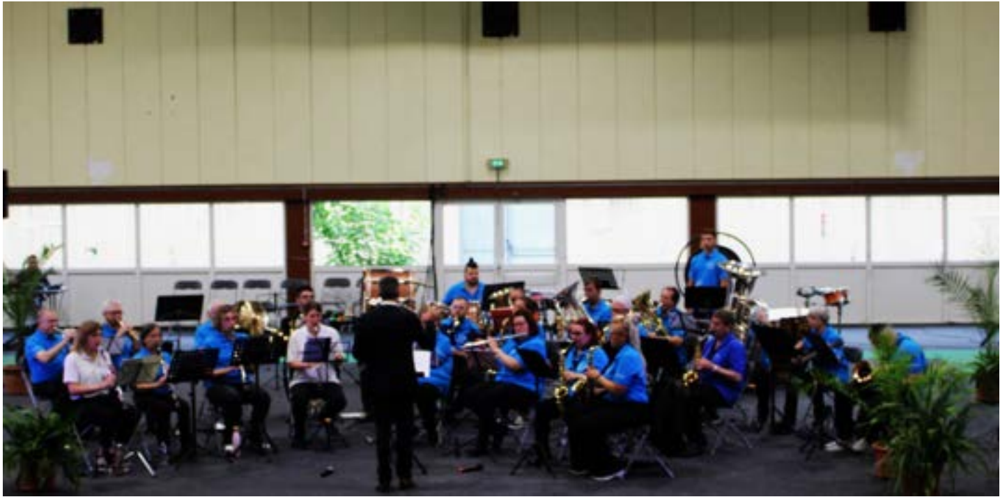
Harmonie l'Union Bouillonnaise