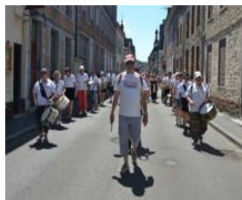
Fête des roses à Givet