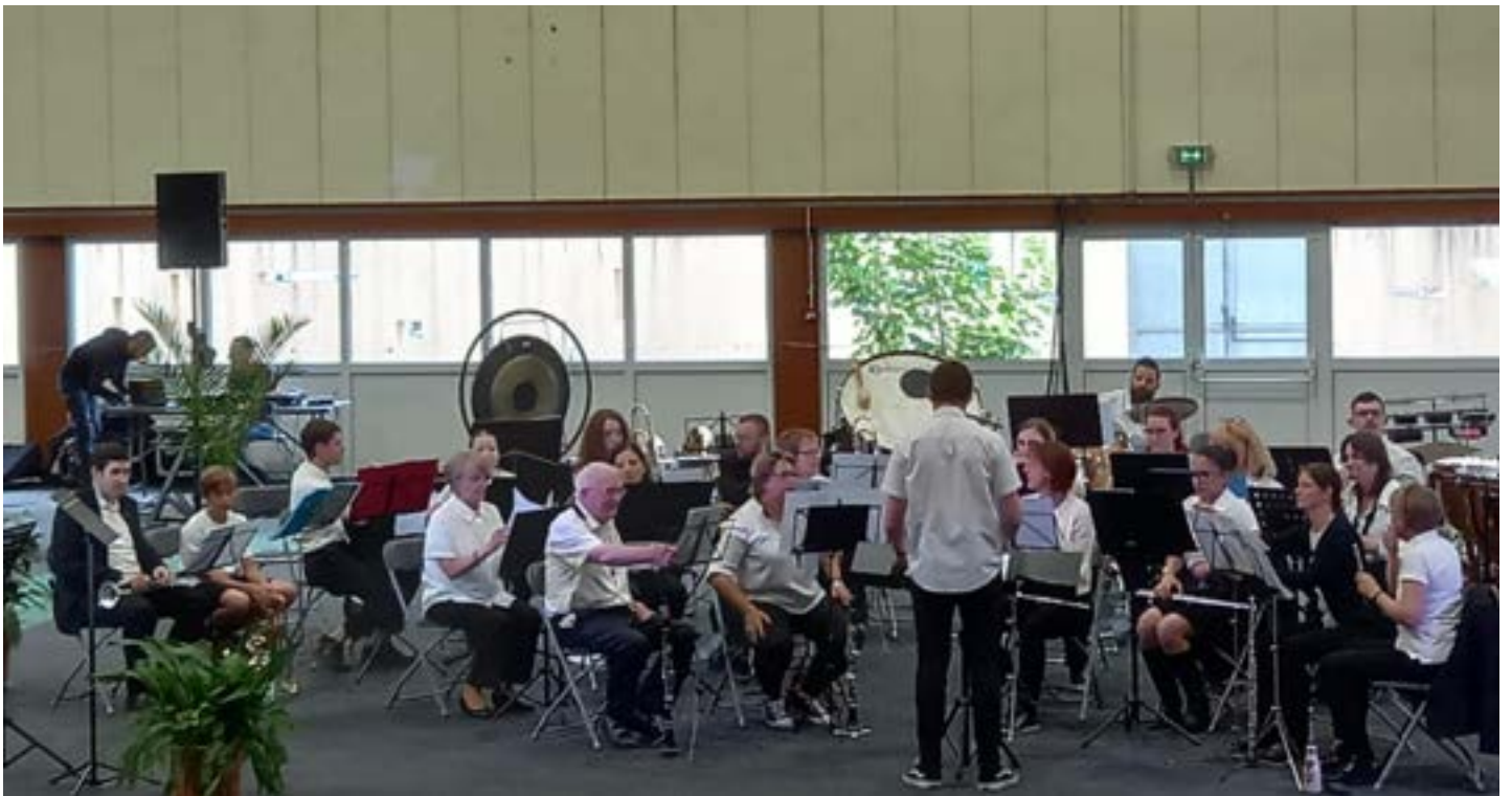
Harmonie de Warcq