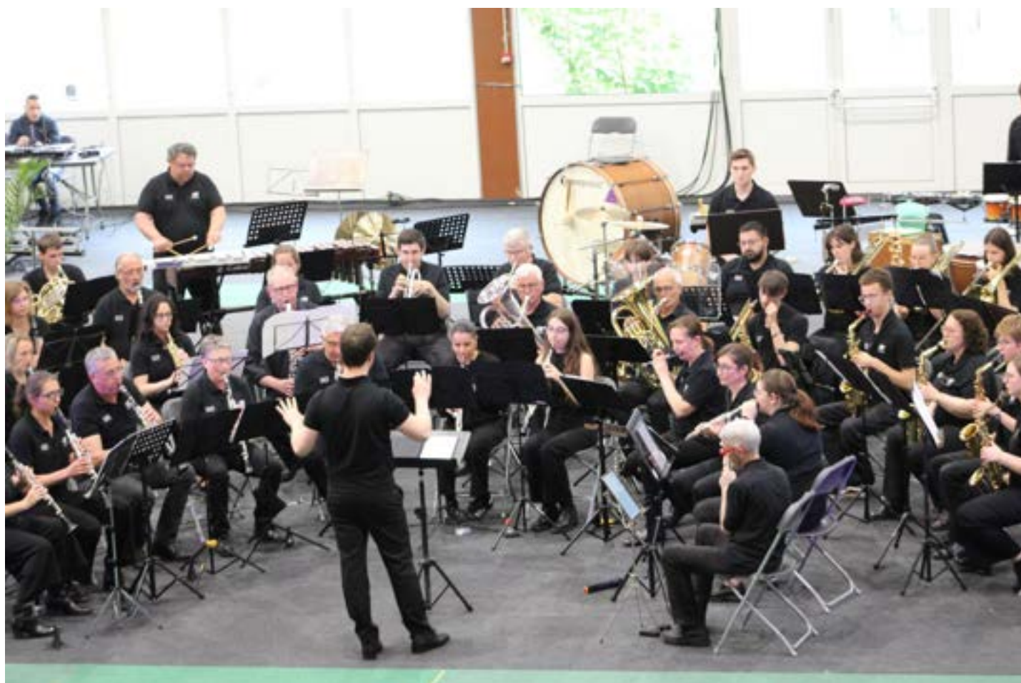
Orchestre d'Harmonie de la ville de Charleville-Mézières