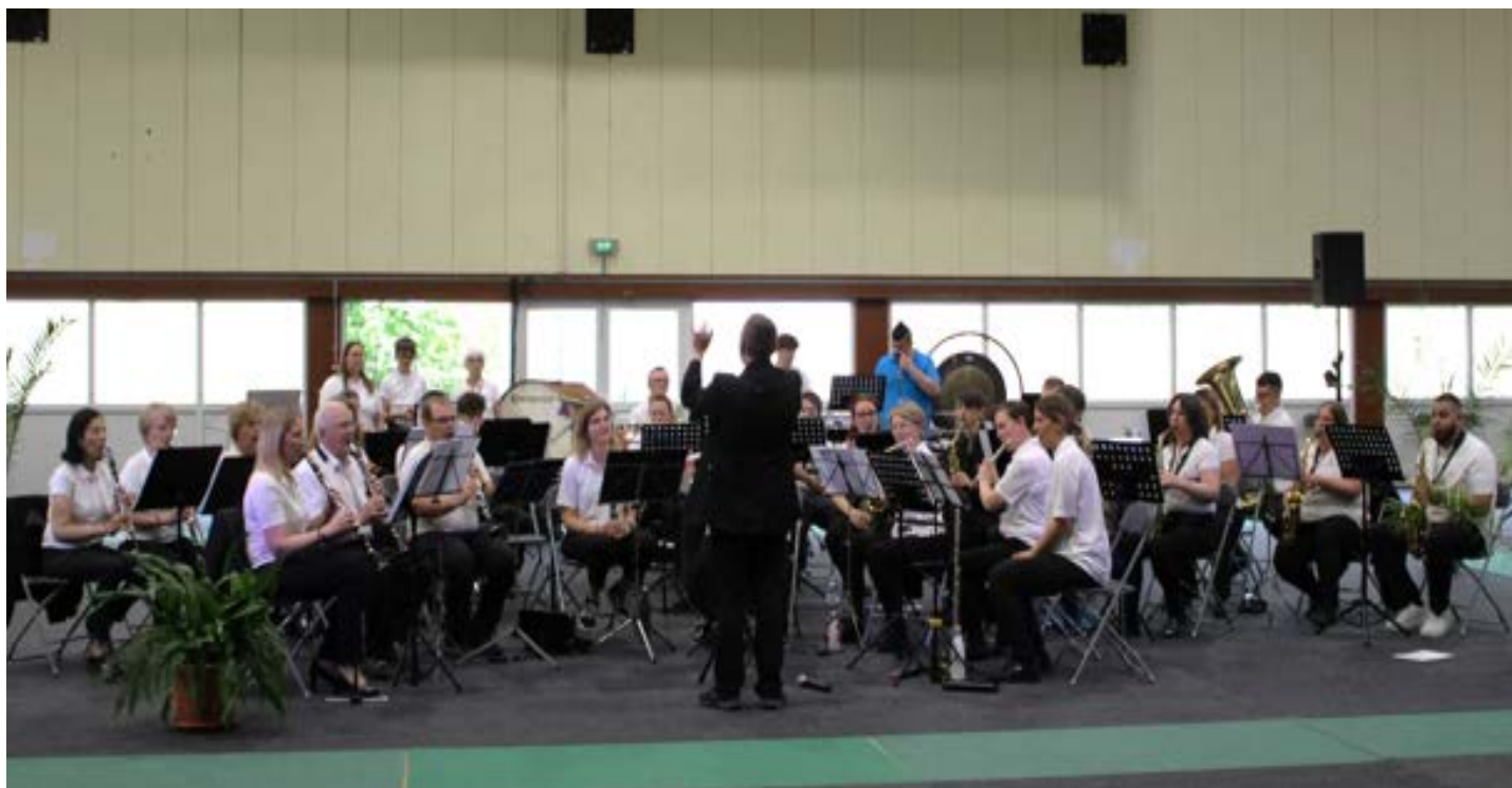
Union Musicale Revinoise