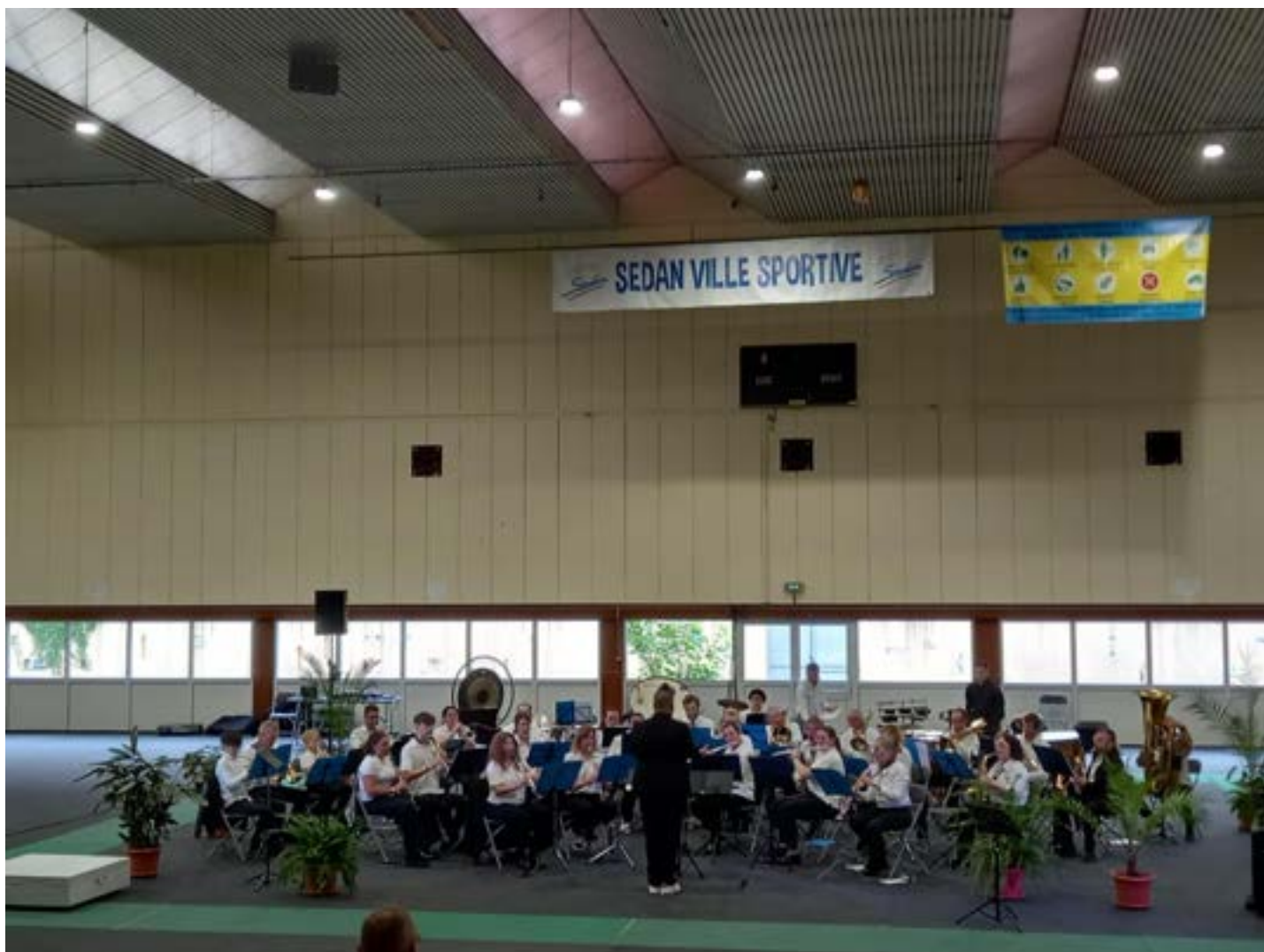
Harmonie Municipale de Monthermé