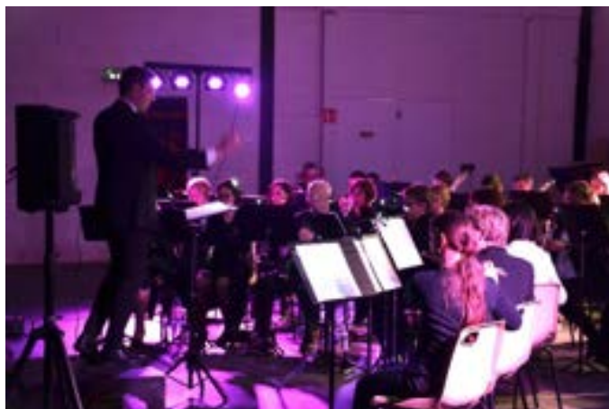
20 décembre : Concert de Noël, spécial musiques de films

Venez suivre nos actualités sur notre Facebook : Harmonie de Warcq. RDV en 2026 pour de nouveaux concerts !