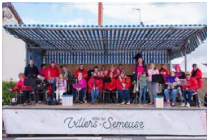
5 octobre : Animation pour la course du Sedan-Charleville