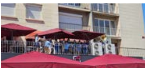
Une fête de la musique pendant une journée ! Merci aux commerçants.