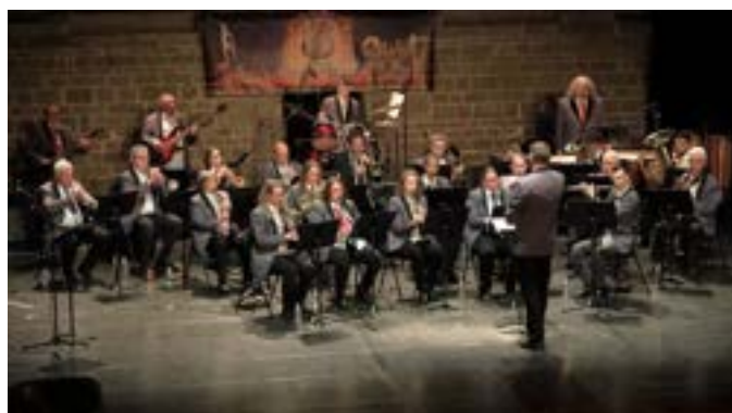
29 mars 2025 : Concert de Printemps au Manège de Givet