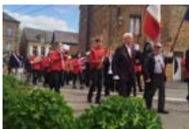
4 mai : Défilé pour la fête de Saint-Hilaire(fête patronale) à Warcq