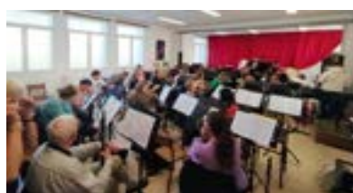
Notre nouvelle salle de musique