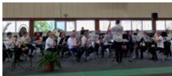
7 juin : participation au Congrès CMF Ardennes